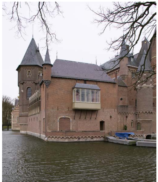
Houten erker bij Kasteel Heeswijk in Heeswijk. S. Technau 2008

In feite toont elke erker een fase in de lange ontwikkeling van een middeleeuws bouwkundig element. Aanvankelijk bedoeld om bij vestingwerken en kastelen gevaar tijdig waar te nemen, werden ze later geliefde plekken om naar buiten te kijken. Ze bieden bewoners meer beleving in huis – ze slaan een brug tussen binnen en buiten. Erkers zijn altijd verbonden met het gebouw waarvoor ze zijn bedacht, en maken zo deel uit van de monumentale waarde van het pand. Vaak gaat het om een enkele erker, maar bij ruimer opgezette gebouwen zie je vaak meerdere exemplaren, verspreid of gestapeld. Aan de gevels zijn erkers echte blikvangers ze verlevendigen het straatbeeld. Er zitten ware pronkstukken tussen, fraai in de gevel geïntegreerd door de toegepaste materialen, vormgeving en kleur. Bij monumenten kom je allerlei historische erkers en arkels tegen. De oudst bewaarde zijn gebouwd in classicistische stijl, waar ze zich lastig lieten integreren. Dat lukte al veel beter bij de Lodewijk XIV-, XV- en XIV-stijlen. De jongere voorbeelden zijn te herkennen aan de gedetailleerdheid in uitwerking van de verschillende neostijlen en de vroeg-twintigste-eeuwse zoals de Chaletstijl en Jugendstil. De Amsterdamse School laat de erkers in baksteen naadloos overvloeien in de strak uitgevoerde gevels.